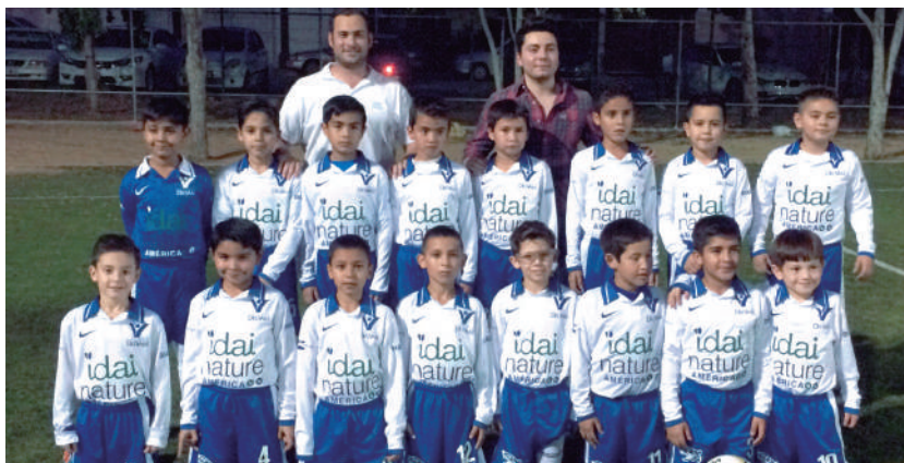
Equipo de fútbol infantil en Culiacán (México)