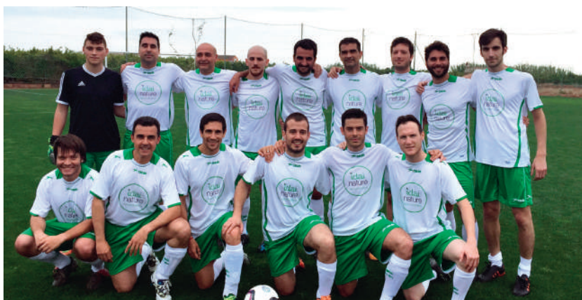
Equipo de fútbol Universidad Agrónomos de Valencia