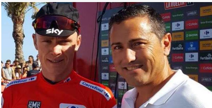
Chris Froome, ganador de la Vuelta a España 2017

Este premio pretende fomentar el esfuerzo común, el compañerismo y el rigor, valores que forman parte del ADN de Idai Nature.