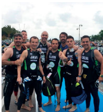
Equipo propio de TRIATHLON

A través de distintos patrocinios deportivos la empresa fomenta valores como el esfuerzo, el trabajo en equipo y el afán de superación.